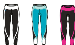
Graphite Caribbean Jewel